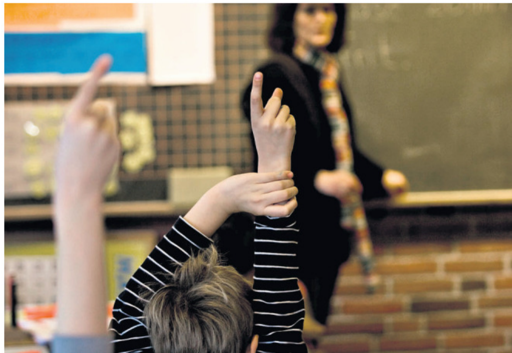
Debatten om fremtidens folkeskole i Viborg Kommune er i fuld gang. Arkivfoto.

Elevtallet vil rasle ned i de kommende år, men det vil antallet af skoleklasser ikke i samme takt, og da små klasser er lige så dyre at holde kørende som store klasser, så kommer der ubalance i økonomien.